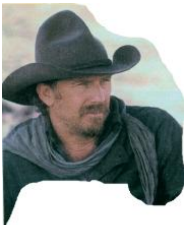
„OPEN RANGE“ mit Kevin Costner

Gleich 2 neue Western starten in Kürze in den deutschen Kinos. Den Anfang macht am 29.01. „Open Range“- Weites Land mit Kevin Costner. Dann folgt am 12.02. „The Missing“ – Entführt mit Tommy Lee Jones.