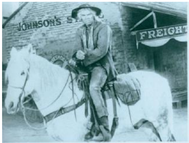
Lee Marvin in „Cat Ballou“ als Kid Shelleen