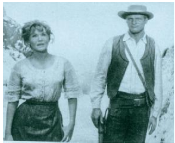
Diane Celento u. Paul Newman in “Hombre”