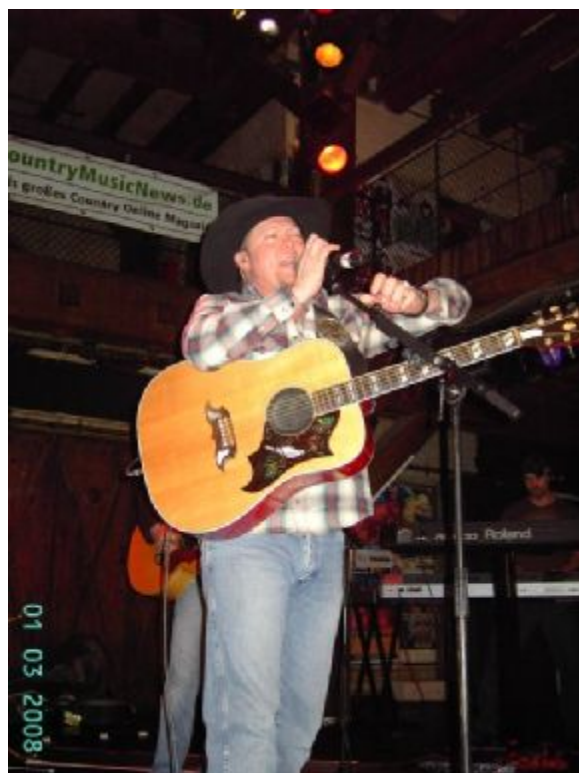
Tracy Lawrence in Hamburg