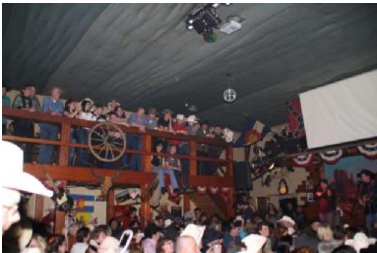
Das 4 Corners platzte aus allen Nähten